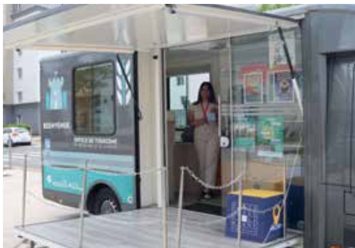
L'Office de tourisme mobile de Paris-Vallée de la Marne était à Champs-sur-Marne en mai et juin. De retour le 12 septembre sur le mail des Tilleuls.