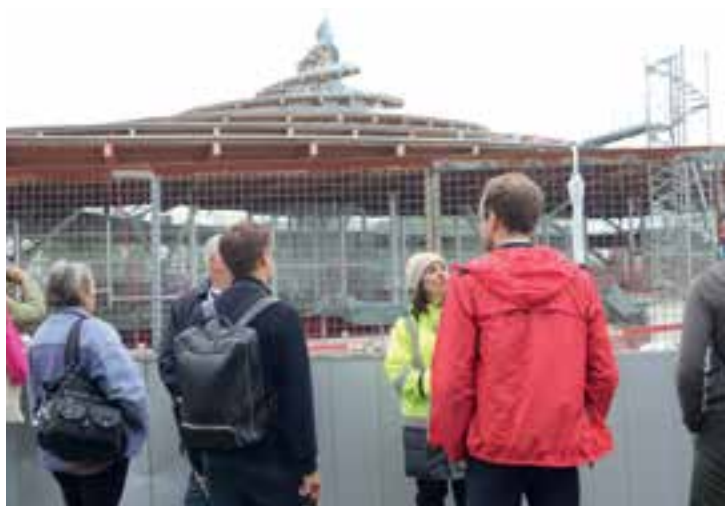
Le Grand Paris Express organise des observations commentées vers la future gare de Noisy-Champs. Prochaine visite gratuite les 19 juillet et 30 août ( grandparisexpress.fr )