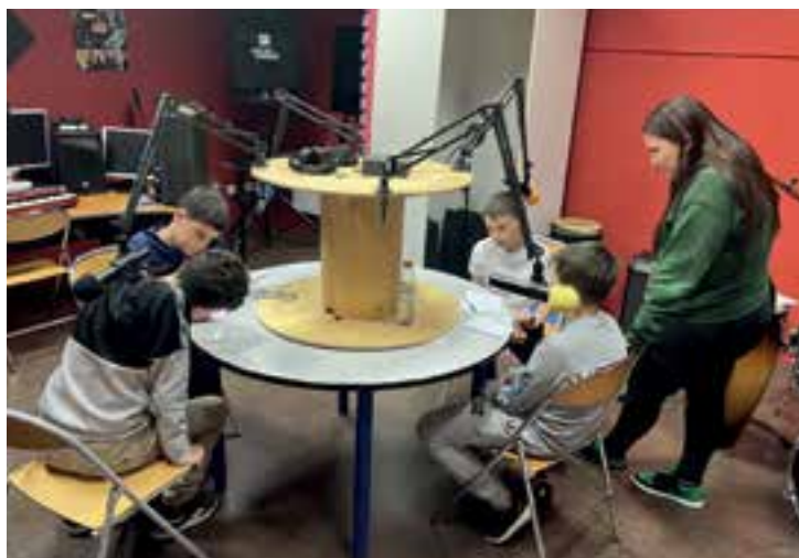
Atelier Slam mercredi 29 mai avec les CM2 des accueils de loisirs au relais jeunesse Pablo Picasso, allée des Noyers.