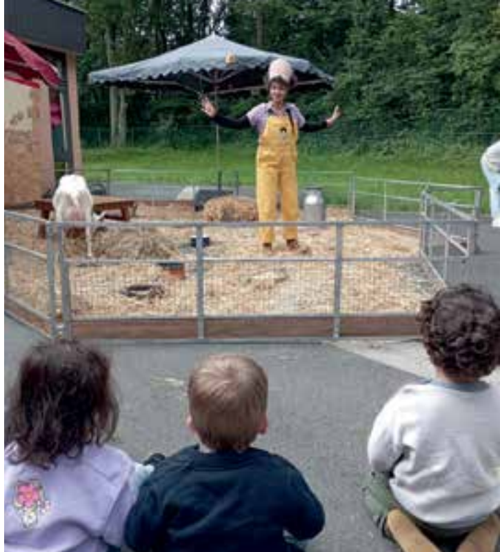
Le 13 juin à la Maison des enfants, la ferme Tiligolo a rendu visite aux petits. L'occasion pour eux de caresser les canetons, lapereaux, porcelet, chevreau, agneau, poules, oie...