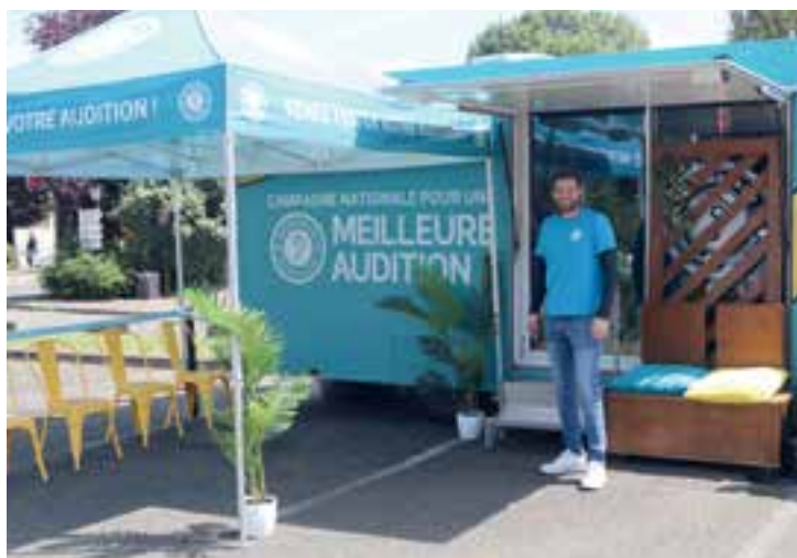
Le camion de dépistage auditif gratuit itinérant pour la campagne nationale pour une meilleure audition sur le parking allée Pascal Dulphy le 3 juin dernier.