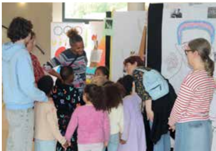
Exposition sur la tolérance du 17 mai au 19 juin en mairie. « Tous différents, tous égaux » véhicule les valeurs de tolérance et des Jeux Olympiques Paris 2024.